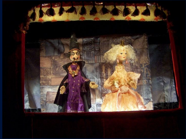
Bild 4 und 5: Spielszenen mit Räuber, Kasper, Zauberer und Prinzessin aus der Handpuppen-Inszenierung „Weihnachten bei Prinzessin Marzipan und König Schokolade“ im THEATER MIRAKULUM