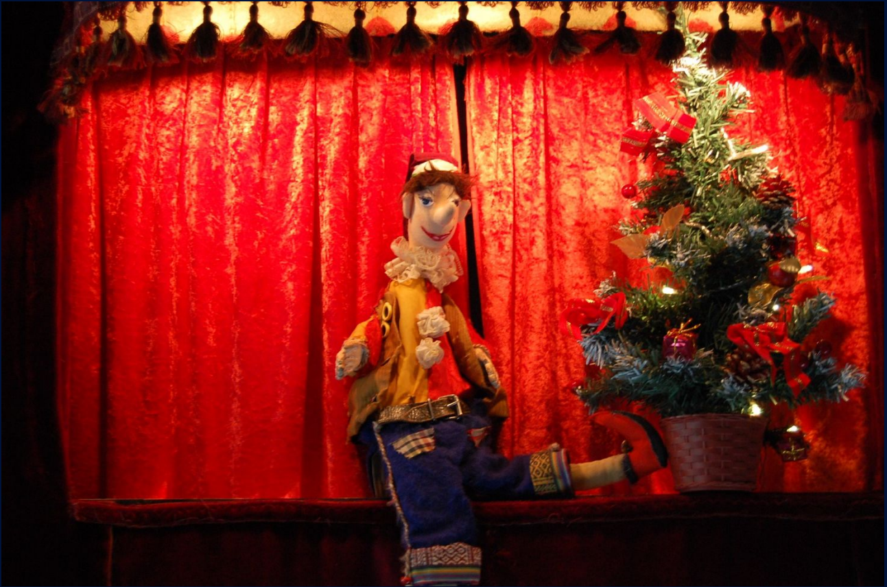
Bild 1: Vor dem Weihnachtsfest gibt es viel zu tun, besonders für Kasper – Vorhangspiel, klassische Handpuppe, aus der Inszenierung „Weihnachten bei Prinzessin Marzipan und König Schokolade“ im THEATER MIRAKULUM

trainieren. Das junge Publikum geht nach der Aufführung mit gestärktem Selbstvertrauen nach Hause und der Erfahrung, dass Theater Spaß macht und soziales Verhalten und Zivilcourage belohnt werden.