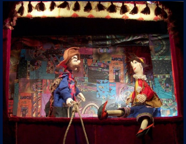
Bild 4 und 5: Spielszenen mit Räuber, Kasper, Zauberer und Prinzessin aus der Handpuppen-Inszenierung „Weihnachten bei Prinzessin Marzipan und König Schokolade“ im THEATER MIRAKULUM